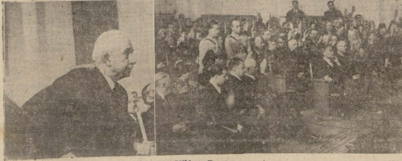
Millî Şef Vilâyet Parti kongresinde